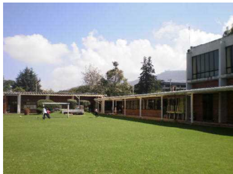
【日本人学校、校舎全景】

その他に本校は、日本の勉強をするだけでなく、現地の言葉や歴史、地理などの現地事情に関わる指導（コロンビア学習）を取り入れたり、現地校と協力して現地の子どもたちとの交流（現地校交流）を積極的に進めたりしています。また、外国語教育として英会話（全学年）や、現地語の学習としてスペイン語（選択制）が行われています。